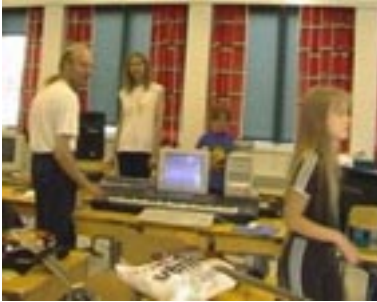
Musavideoleiri Laviassa. Studio luokassa

9.11. Vuoden 2001 koulukarnevaalin suunnittelukokous. Porin Promenadikeskus, videotytkki + äänentoisto kokoussaliini.