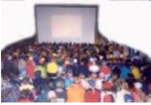
Iso joukko koululaisia katsomassa samaa kangasta