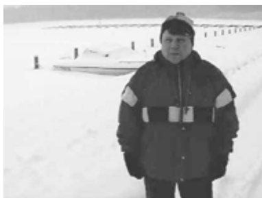
Meka TV:n kuvausryhmän jäsen Euran lakeuksia ihmettelemässä

MEKA TV on alueellinen kuvallisen ja sähköisen viestinnän koulutustuotanto- ja levitysverkosto, jonka painopistealueina ovat erityisryhmät sekä lapset ja nuoret. Toimintaverkoston kantavina verkkosolmuina on toiminut 11 yhteisöä ja 77 henkilöä. MEKA TV on ollut kiinteässä yhteistyössä SEKK:n kanssa varsinkin lapsille ja nuorille järjestetyssä toiminnassa.