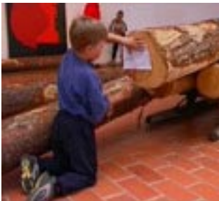
Kuva "Lasten Maire" -dokumentista